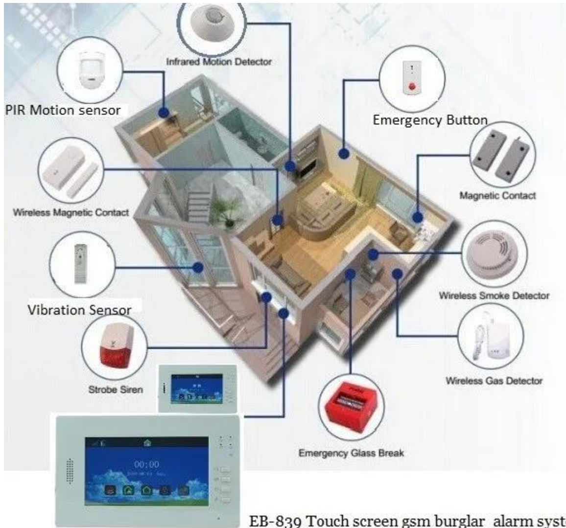
EB-839 Touch screen gsm burglar alarm system with CID monitoring dial