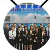
2015 Shenzhen Fair