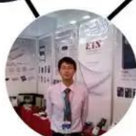
2012 shen yang Fair