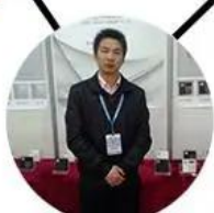
2013 shen yang Fair