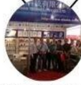
2013 Shenzhen Fair