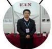
2013 Shenyang Fair