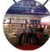
2013 Shenzhen Fair