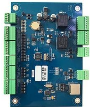
Dual Doors Access Control