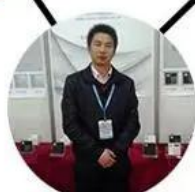
2013 shen yang Fair