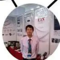
2012 shen yang Fair