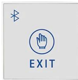
Bluetooth Door Button