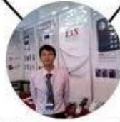
2012 Shenyang Fair