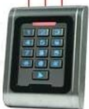
Single Door Access control Keypad