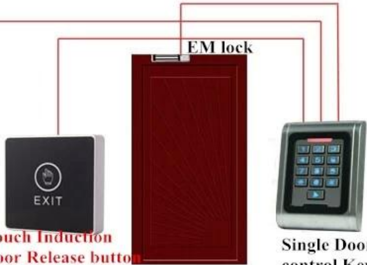
Touch Induction Door Release button EB-20B