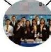
2015 Shenzhen Fair