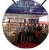
2013 Shenzhen Fair