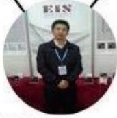
2013 Shenyang Fair