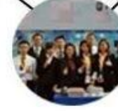
2015 Shenzhen Fair