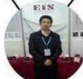
2013 Shenyang Fair