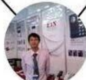
2012 Shenyang Fair