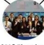
2015 Shenzhen Fair