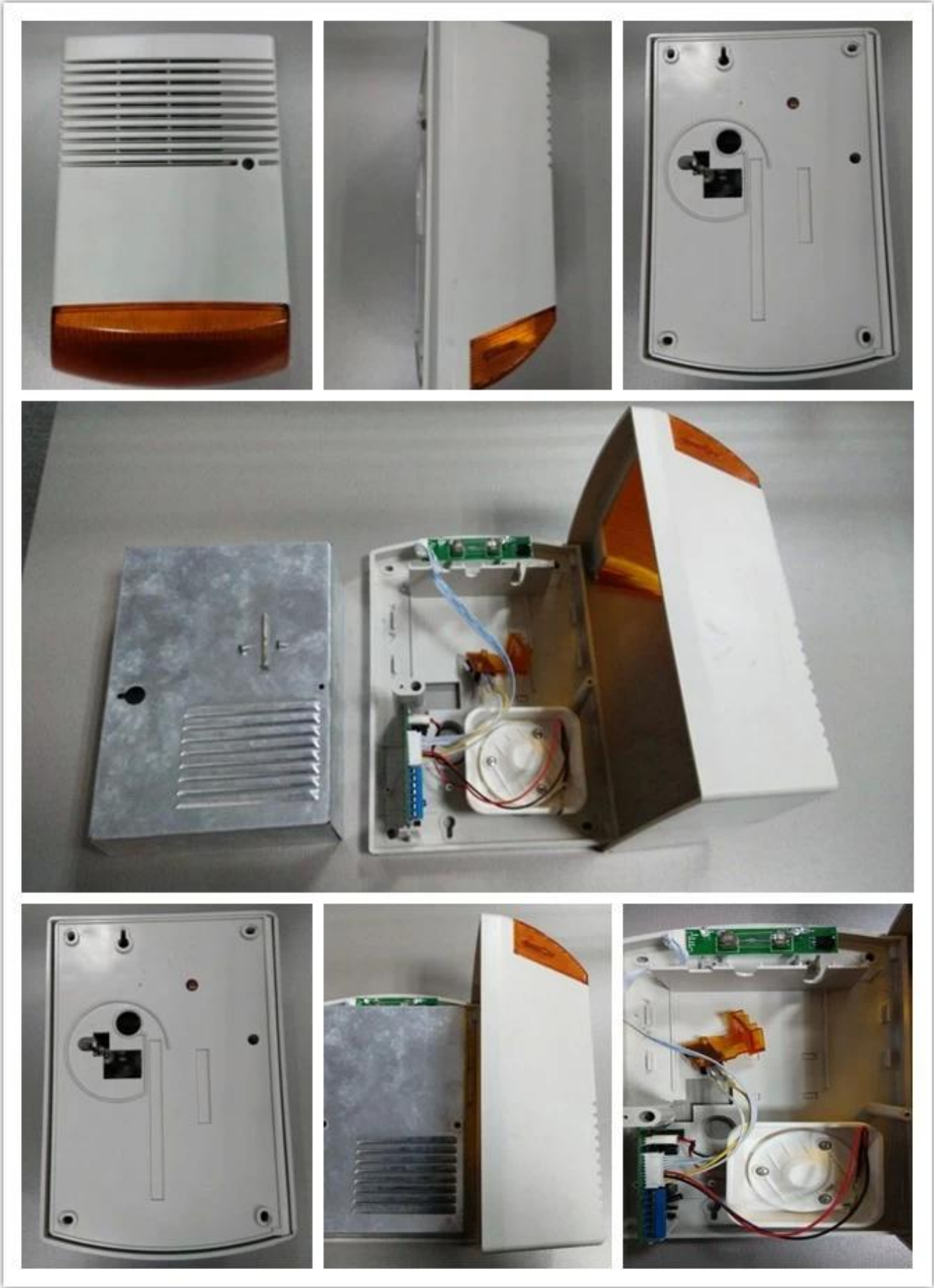
Các điện tử ngoài trời còi báo động là các strobe sừng màu đỏ với