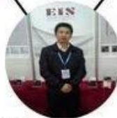
2013 Shenyang Fair